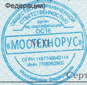
Схема сертификации: 1с (ГОСТ Р 53603-2020 Оценка соответствия. Схемы сертификации продукции в Российской Федерации)